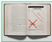
Die neue Typographie, 1928