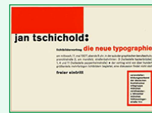
Die neue Typographie, publicité, 1928