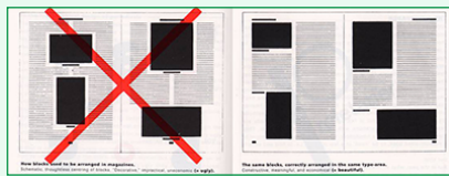
Die neue Typographie, extrait, 1928